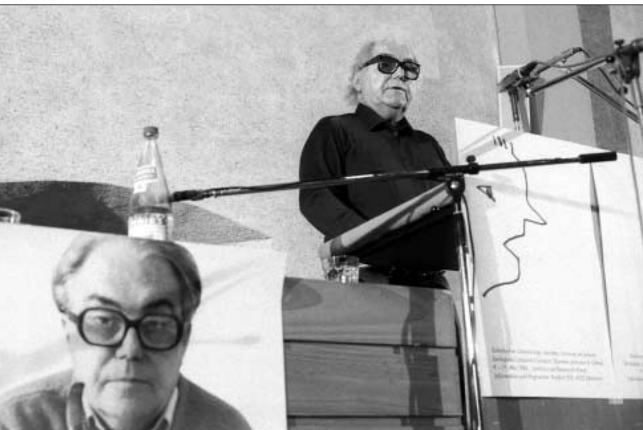
Höhepunkt Max Frischs Rede über das Scheitern der Aufklärung an den 8. Solothurner Literaturtagen 1986. ALOIS WINIGER

Lüthy: Ich denke schon. Auch wir müssen neue Wege finden, um an Geld zu kommen. Und auch wir brauchen engagierten Nachwuchs.