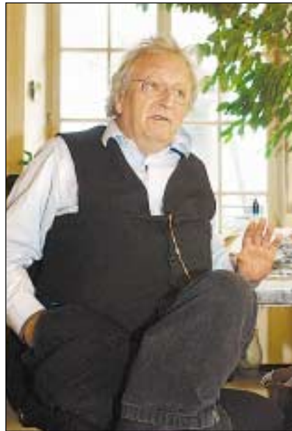
Peter Bichsel Vertraut mit den Solothurner Alltagen und Literaturtagen.

Die Solothurner Literaturtage haben sich das zunutze gemacht – ausgerechnet in jenem Solothurn, das sonst kaum eine Tradition von literarischen Lesungen kennt. Es gibt wohl keine andere Stadt in der Schweiz, in der übers Jahr so wenige Lesungen stattfinden. Es scheint so zu sein, dass der Stadt der Glanz nach aussen genügt – er sei ihr gegönnt. Mir ist das recht, die Solothurner Alltage zwischen den Solothurner Tagen gibt es jedenfalls nach wie vor. Ich mag sie mehr als die Tage, und wegen ihnen lebe ich hier.